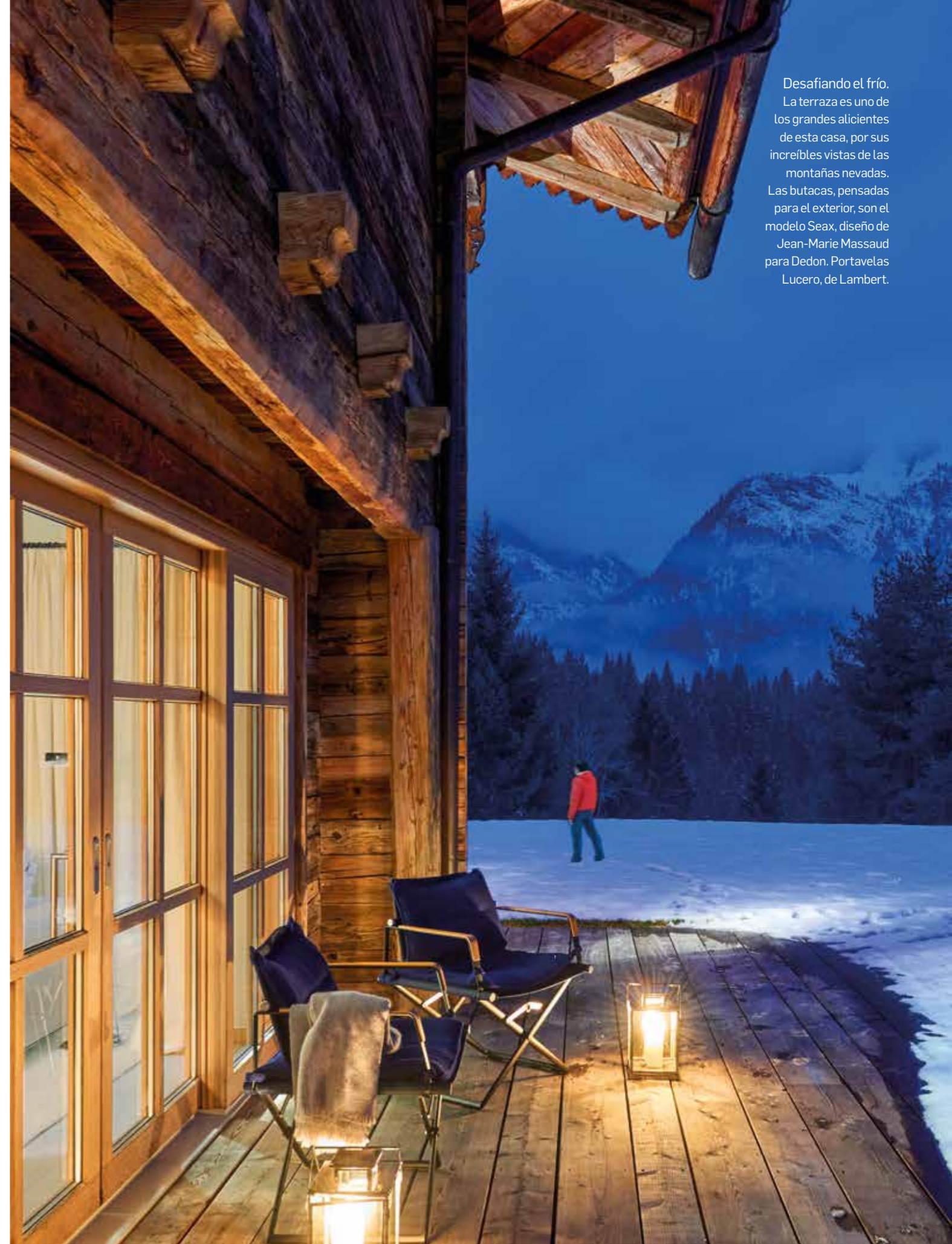
Desafiando el frío. La terraza es uno de los grandes atractivos de esta casa, por sus increíbles vistas de las montañas nevadas. Las butacas, pensadas para el exterior, son el modelo Seax, diseño de Jean-Marie Massaud para Dedon. Portavelas Lucero, de Lambert.

nacional Hohe Tauern. Como no podía ser de otro modo, el proyecto tomó como referencia la imaginación visual de una casa alpina —la calidez y suavidad de los materiales siempre está presente—, pero con interiores actualizados que eluden la rusticidad mimética de las viviendas tradicionales. Así, la moderna tecnología de aislamiento ha permitido que en lugar de pequeñas ventanas para preservar el calor, el espacioso salón a doble altura goce de amplias aberturas al exterior. Esto, junto con el rediseño de la terraza, tuvo como objetivo prioritario encuadrar y enfocar la mirada hacia las montañas de Pinzgau, verdes o nevadas según la época del año. Además, el antiguo garaje se convirtió en una oficina doméstica con un área lounge anexa. En la sala de estar, se quitó la estufa de azulejos existente y se reemplazó por una chimenea abierta e imponente, revestida con planchas de acero; una referencia creativa a la fuerza elemental del fuego, en palabras del propio Gruber. Desde el salón o desde el interior de la bañera, el paisaje nevado es un espectáculo envolvente, casi narcotizante. ■