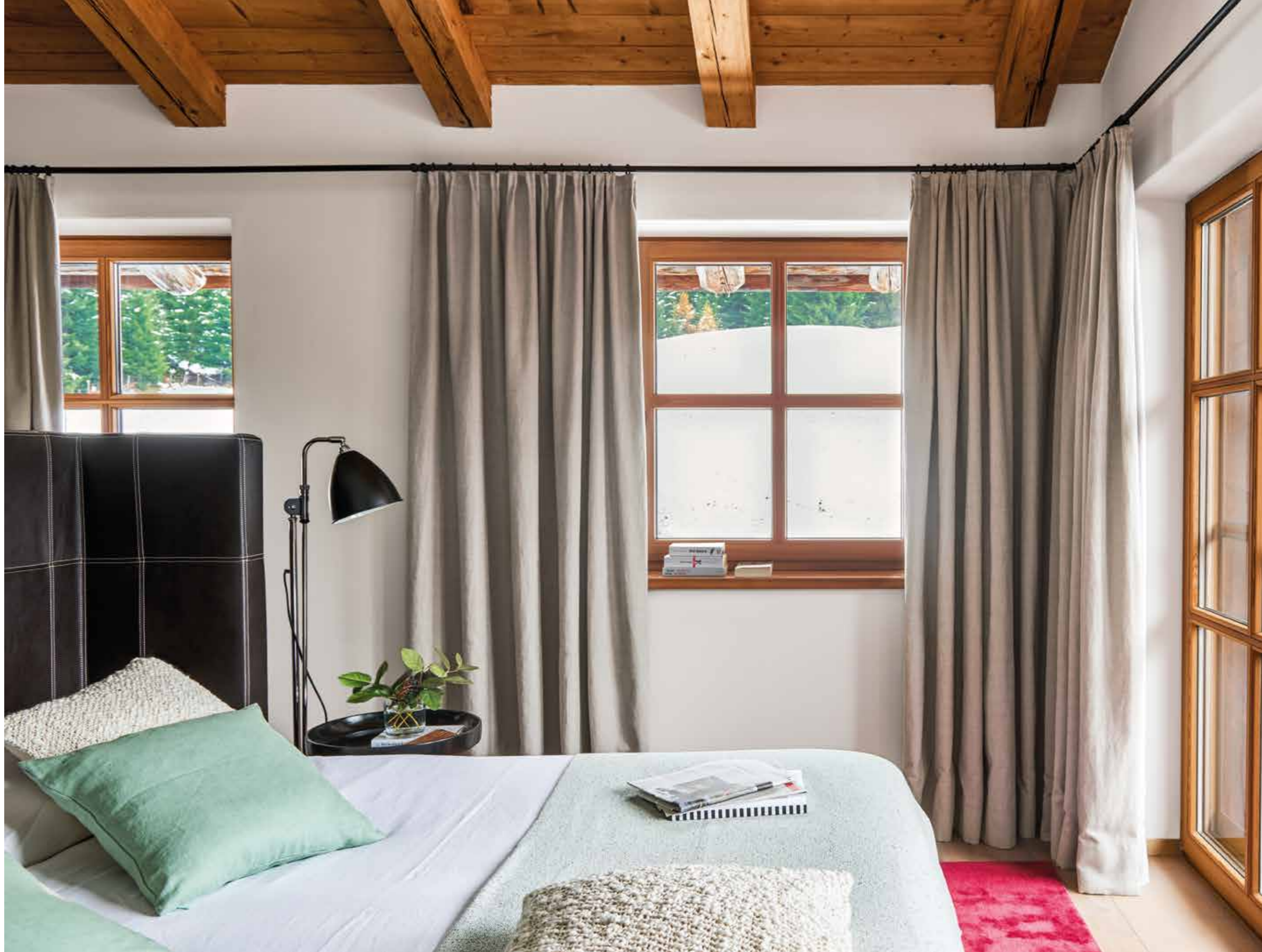
Dormitorio principal. El cabecero de la cama, de piel, es un diseño de Bernd Gruber Design. Ropa de cama, de 120 % Lino. El cojín verde se ha comprado en Matèria. Mesita Bowl, del fabricante Mater, diseñada por Ayush Kasliwal. Lámpara Bestlite B14, de Gubi.