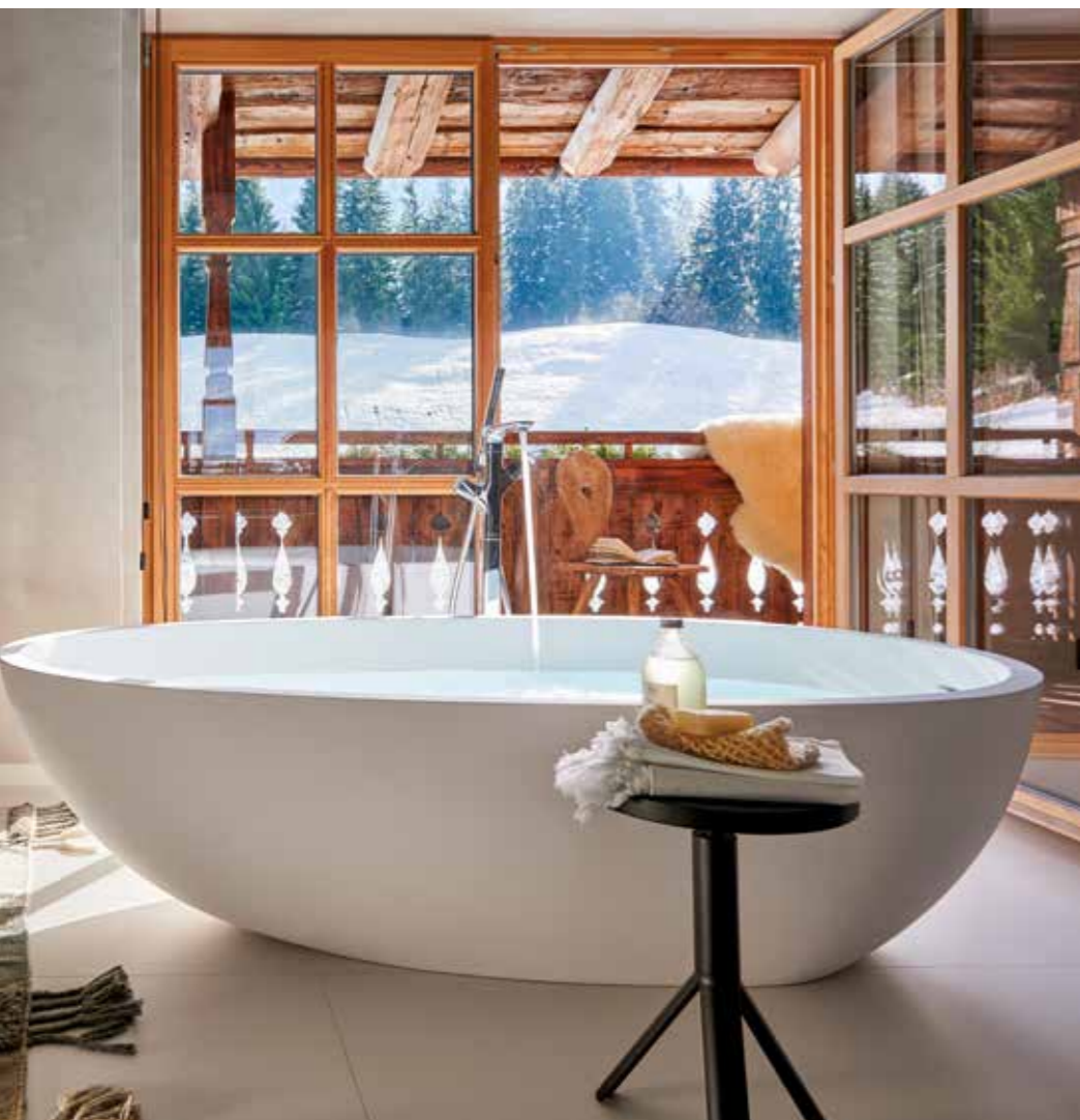
Baño après ski. La estratégica ubicación de la bañera permite tomar un relajante baño caliente, después de un día de esquí, mirando hacia el paisaje nevado, lo que es todo un lujo. La bañera es el modelo Spoon XL, diseño de Benedini Associati para Agape.

nacional Hohe Tauern. Como no podía ser de otro modo, el proyecto tomó como referencia la imaginación visual de una casa alpina —la calidez y suavidad de los materiales siempre está presente—, pero con interiores actualizados que eluden la rusticidad mimética de las viviendas tradicionales. Así, la moderna tecnología de aislamiento ha permitido que en lugar de pequeñas ventanas para preservar el calor, el espacioso salón a doble altura goce de amplias aberturas al exterior. Esto, junto con el rediseño de la terraza, tuvo como objetivo prioritario encuadrar y enfocar la mirada hacia las montañas de Pinzgau, verdes o nevadas según la época del año. Además, el antiguo garaje se convirtió en una oficina doméstica con un área lounge anexa. En la sala de estar, se quitó la estufa de azulejos existente y se reemplazó por una chimenea abierta e imponente, revestida con planchas de acero; una referencia creativa a la fuerza elemental del fuego, en palabras del propio Gruber. Desde el salón o desde el interior de la bañera, el paisaje nevado es un espectáculo envolvente, casi narcotizante. ■