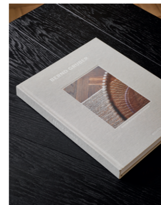
Bilder: © Bernd Gruber, Fotograf Alexander van Berge, Styling: Bregje Nix

Sie steht im Zentrum der Teamarbeit von den (Innen-)Architekten, Designern und Handwerkern. Bernd Gruber versteht darunter, tiefer zu denken, als es auf den ersten Blick den Anschein hat. Sich zu überlegen, was die Bauherren wirklich berührt. Was macht eine Atmosphäre einzigartig? Wie können Persönlichkeiten in einem für sie individuell erstellten Konzept wiedergespiegelt werden? Welche Materialien, Stoffe ... unterstützen das Konzept? Das sind die Fragen, die am Anfang jedes Projektes stehen.