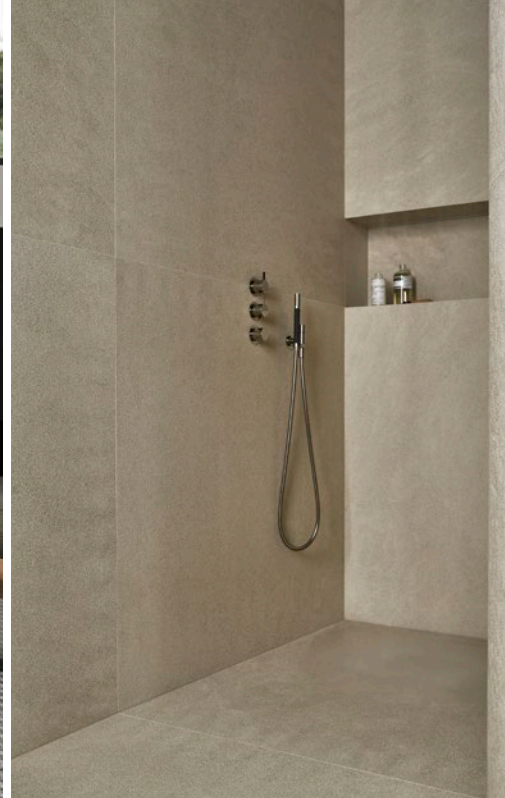
← Purismus verleiht dem Bad aus Naturstein einen meditativen Spa-Charakter. Armaturen: Vola