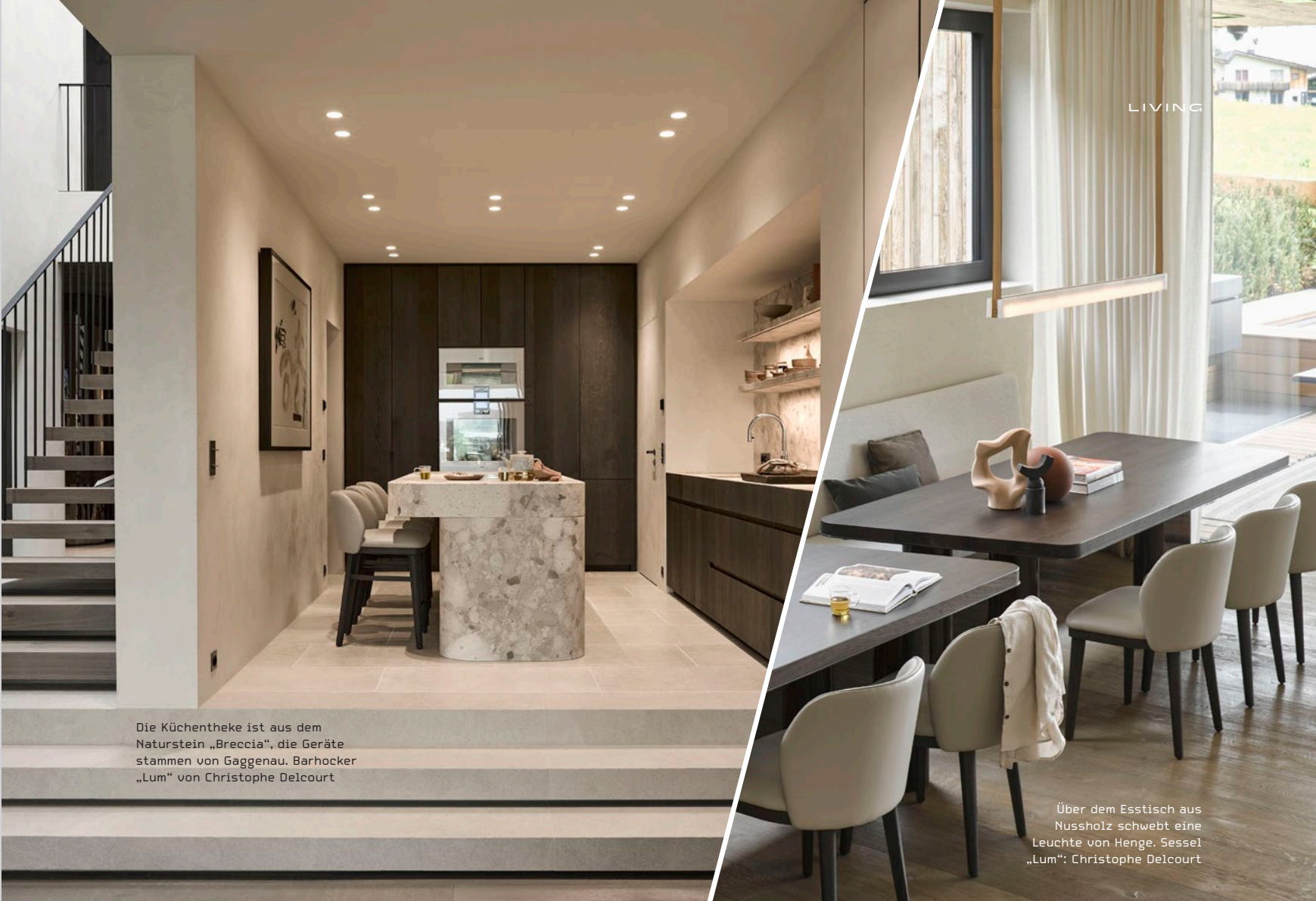
Die Küchentheke ist aus dem Naturstein „Breccia“, die Geräte stammen von Gaggenau. Barhocker „Lum“ von Christophe Delcourt