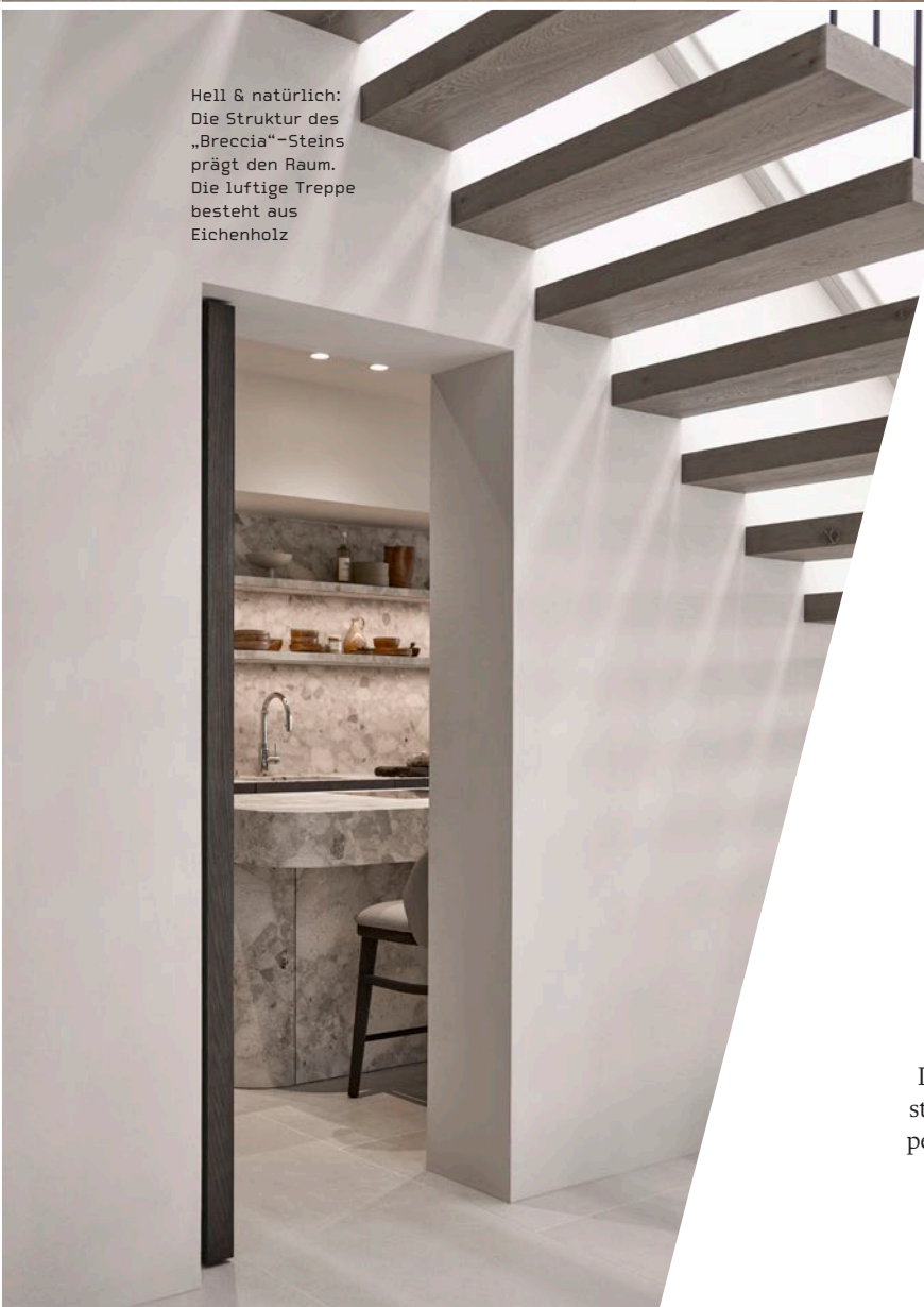
Hell & natürlich: Die Struktur des „Breccia“-Steins prägt den Raum. Die luftige Treppe besteht aus Eichenholz