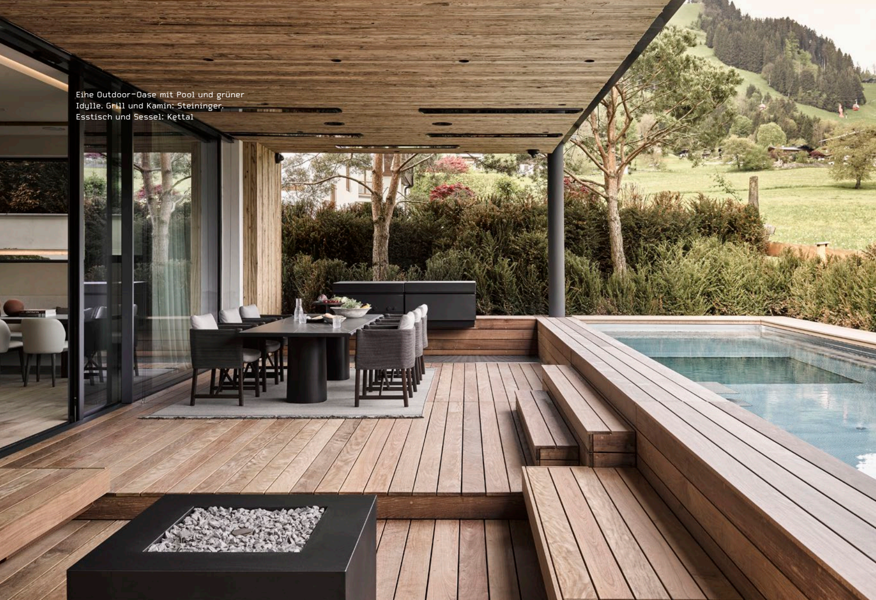
Eine Outdoor-Oase mit Pool und grüner Idylle. Grill und Kamin: Steiningger, Esstisch und Sessel: Kettal